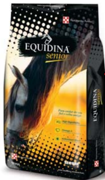
EQUIDINA SENIOR 20 kg