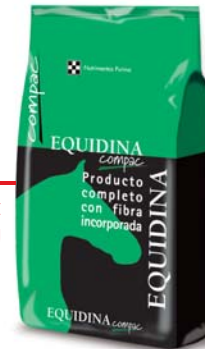
EQUIDINA COMPAC 40 kg